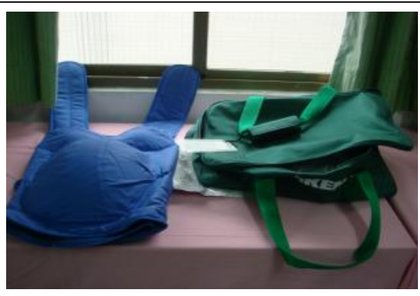
產兒示範中心--「Nst 無壓力試驗儀器」