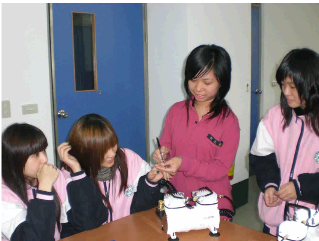
▼學生利用美衛教室實驗桌操作相關課程