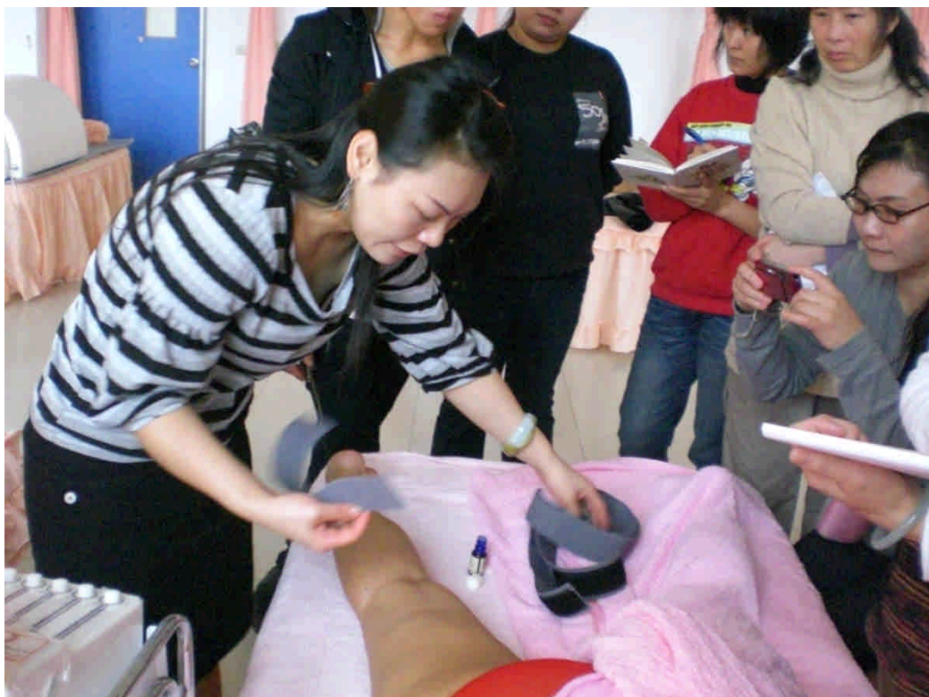
▼ 老師指導學生使用低周波儀