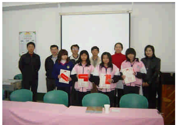
得獎者與評審合影