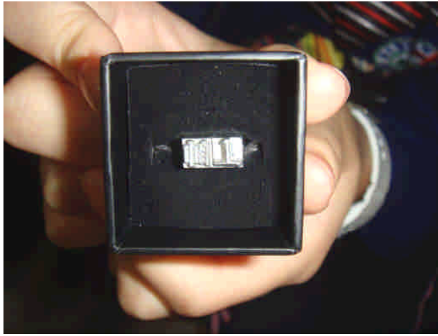
已難能見到的人工排字的活字版鉛塊