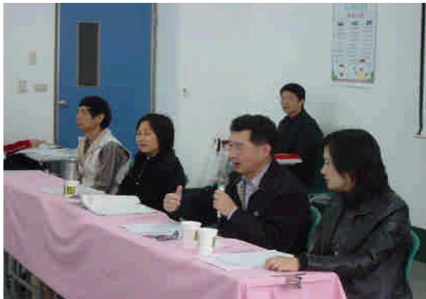
新詩組評審委員講評