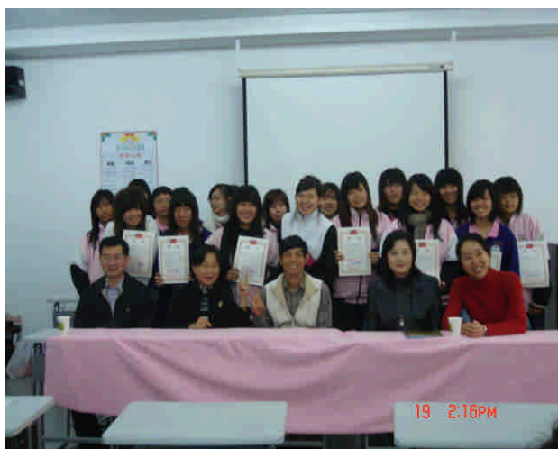
得獎者與評審合影