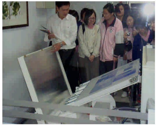
參觀電腦製版過程

6、舉辦新生文藝獎、報導文學獎、決選作品（複評）評選會、出版優異作品集，以文會友，以友輔仁，散播藝文種子；師生一同探訪區域值得敬重取法的人物，深耕閱讀與寫作的園地，三、五年後，必可長成枝枝小樹，持續澆灌，十年後，當可蔚然成林。