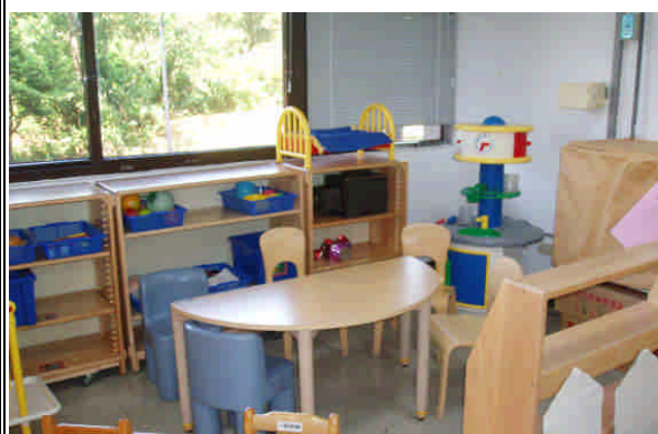
參觀長庚幼保系專業教室