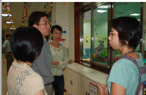
與實驗托兒所主任進行實務交流