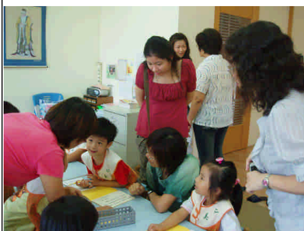
觀摩幼兒讀經教學