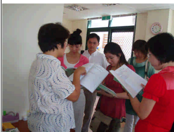
觀摩親師聯絡簿內容