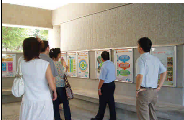
參觀長庚幼保系藝術走廊