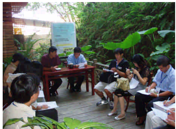
綜合討論：如何發揮身教、言教、境教 的功能營造優質的校園文化