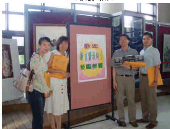
長庚幼保系精心設計的歡迎海報