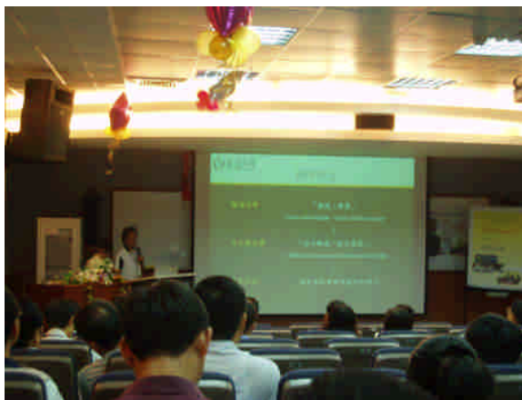
育達品德教育經驗分享(一)