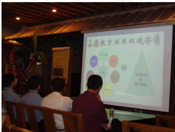
育達品德教育經驗分享(二)