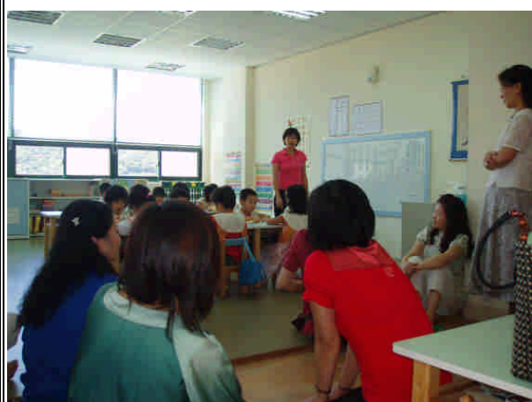
觀摩教學活動進行